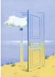
Ilustración de tapa:

Composición a partir de la obra “La Victoria” La Victoire (1939) de René Magritte.